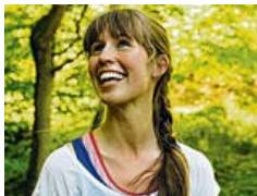
Der Wettstreit der Wissenschaftler