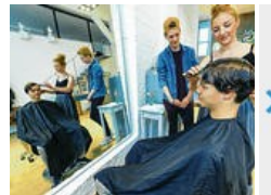
Personalnot in der Friseur-Hauptstadt

vor Krieg und Armut. Aber wer sind die "neuen Nachbarn"? Welche Veränderungen bedeutet das für uns Lübecker und wie können wir helfen?