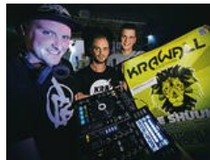
„Wild Life“, perfekt organisiert