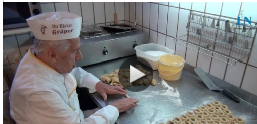
So einfach sind perfekte Hefekringel